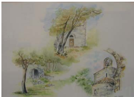
1 er prix : Mme Sylvie BOURDAT Aquarelle

Le dimanche 17 décembre à 16 heures, à la salle des fêtes, grand rassemblement familial avec :