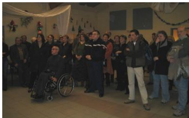
Une partie du public pendant l'allocution de monsieur le Maire .

Avant de terminer par la présentation des projets 2005 avec notamment la construction des appartements il a fait part de son mécontentement devant la conduite de quelques personnes qui continuent de jeter n'importe quoi dans les conteneurs a ordures ménagères.