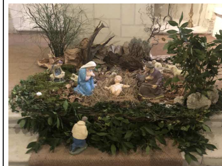
La crèche installée dans l'église.

C'est pourquoi, le 23 novembre, quelques personnes motivées du village et de Saint Paul Trois Châteaux, ont pu commencer à frotter, dépoussiérer, ranger, réorganiser l'ensemble du lieu. Ce moment a été très convivial. Malgré l'efficacité de cette matinée, il reste encore à faire !