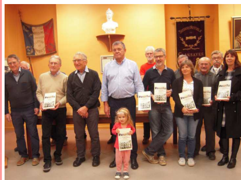
Les représentants des associations patriotiques sont venus présenter leurs livres.